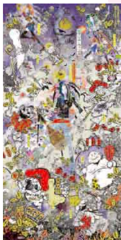
宗像三女神と踊る七福神 CGプリント 45×120cm