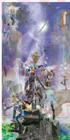
現代日本の女神的風景 CGプリント 45×120cm