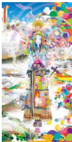
コスプレ女神 山は天国 CGプリント 45×120cm