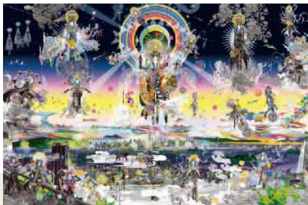
箕面豊陀羅 夕暮れの箕面スパーガーデンからの展望に現れたサラスパティと女神達 CGプリント 270×180cm

LEDランタンの明かりで楽しむ「サタデー・ナイト・タイム」特別企画 12月7・14日(土)pm4:00~6:00随時